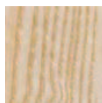
Lato esterno ed interno fianchi FRASDOG 998 nocciola External and internal sides FRASDOG 998 hazel